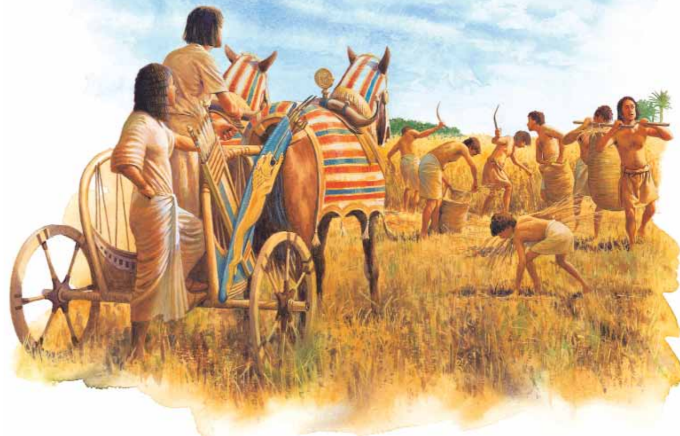
Scène de moisson inspirée d'une peinture murale de l'Égypte ancienne.

Joseph découvrit la dure réalité de la vie d'esclave. En dépit de son bon travail, il fut jeté en prison parce que quelqu'un avait raconté des mensonges à son sujet. Mais grâce à la sagesse que Dieu lui avait donnée, il sut interpréter des rêves et gagna peu à peu le respect de son entourage.