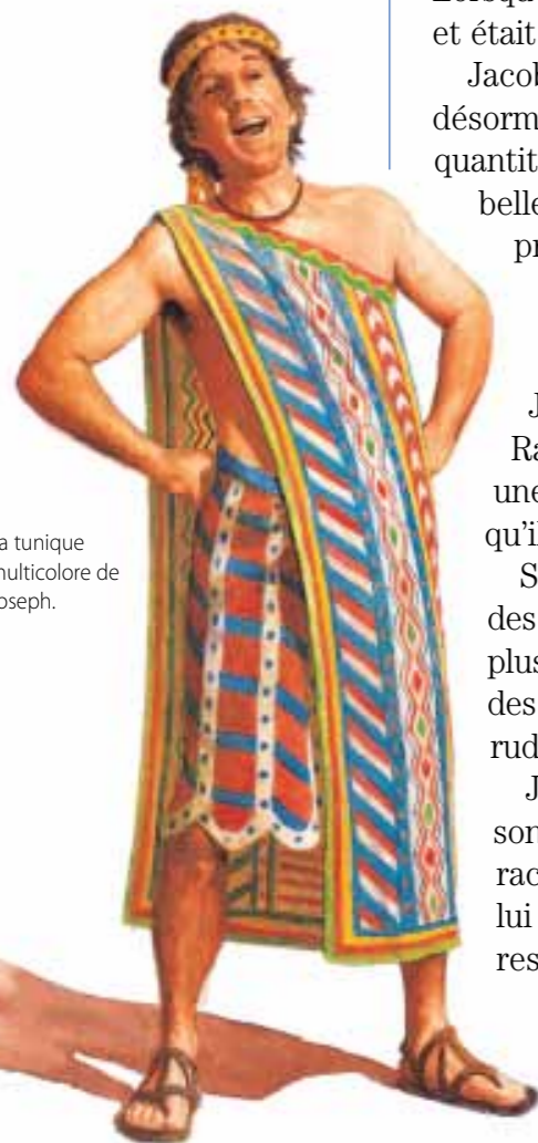
La tunique multicolore de Joseph.

Sur le chemin qui le ramenait en Canaan après les longues années passées à travailler pour Laban, Jacob rencontra un étranger qui lutta avec lui. Le combat dura toute la nuit et quand le jour se leva, Jacob comprit qu'il s'était battu avec Dieu. L'étranger lui donna un nouveau nom pour marquer l'événement : il ne s'appellerait plus Jacob mais Israël. Jacob avait douze fils, d'où sortiraient douze grandes familles : les douze tribus d'Israël.