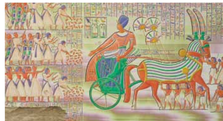
Peinture murale égyptienne. À cette époque, les roues des chars comportaient six rayons.

La Bible dit que le pharaon récompensa la fidélité de Joseph en le faisant monter sur son deuxième char. Tous ceux qui le voyaient devaient lui témoigner du respect.