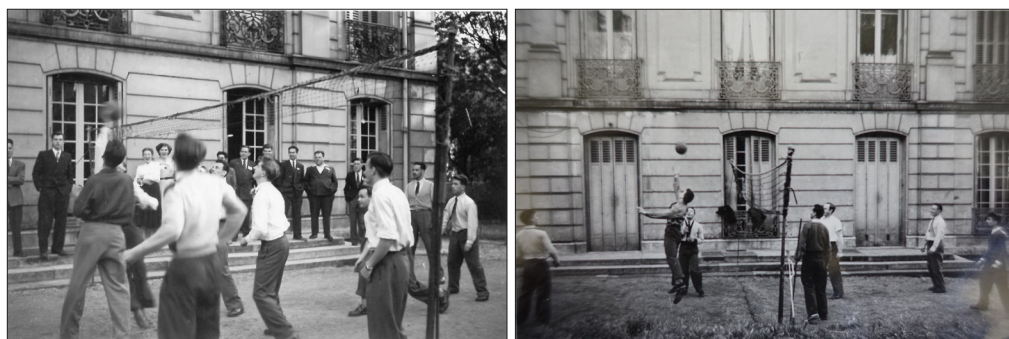
Figure 29 : Activité physique « obligatoire ». Volley, avec ou sans spectateurs, toujours en cravate !